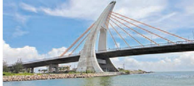
屏東大鵬灣國家風景區，環灣道路上處處是賞月落腳處，跨海大橋入夜後的光雕美景，更讓大鵬灣賞月情調滿分。