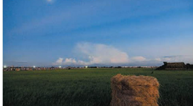
桃園地景藝術節在海軍桃園基地登場，民眾可在黃昏時的空曠廠區中，欣賞天色轉化成墨藍，月亮逐漸升起的美景。