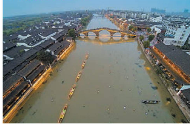
塘樓古鎮的廣濟橋和運河上的綵燈、遊船組成美麗風景。